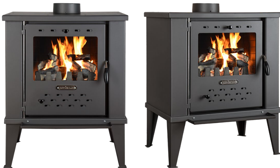
Piec opalany drewnem FENIX 12 kW